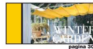
GIARDINO D'INVERNO pagina 30