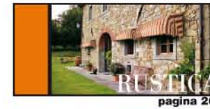
CAPOTTINA SPORTIVA pagina 26