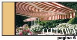
TOP : GRANDE E LEGGERA pagina 6