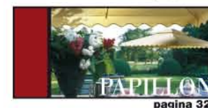
OMBRELLONE CON SOSTEGNO LATERALE pagina 32