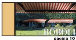
LA PIÙ GRANDE E ROBUSTA pagina 10