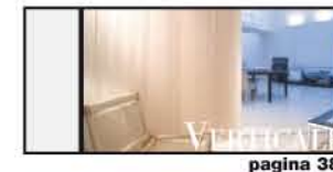
LA TENDA PARETE pagina 38