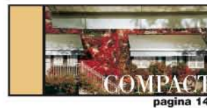
A CHIUSURA TOTALE pagina 14