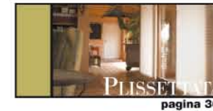
SCORRE ANCHE DAL BASSO pagina 36