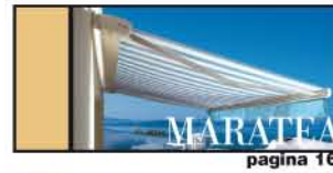
MASSIMA PROTEZIONE DAGLI AGENTI pagina 16