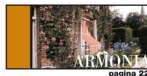
PER TUTTE LE FINESTRE E PER BALCONI INCASSATI pagina 22