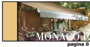
LA PIÙ VERSATILE pagina 8