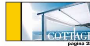
PER STRUTTURE A VERANDA pagina 28