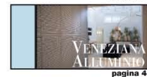
ARREDA CON LA LUCE pagina 40

Su ogni pagina di questo catalogo troverete qualche suggerimento sull'utilizzo più consueto per ogni modello. Si tratta di consigli puramente indicativi: sarete voi a confrontare ogni tenda con le vostre esigenze.