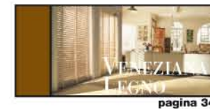
LUCE E CALORE DEL LEGNO pagina 34