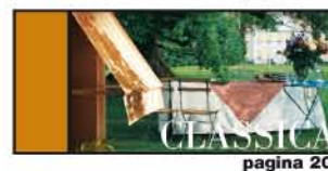
UNIVERSALE PER BALCONI E FINESTRE pagina 20