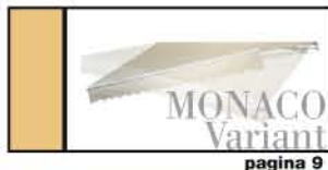
SEGUE I RAGGI DEL SOLE pagina 9