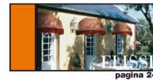
CAPOTTINA ELEGANTE pagina 24