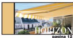
URBAN DESIGN pagina 12