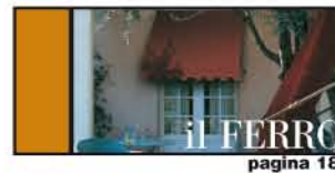
PER EDIFICI D'EPOCA pagina 18